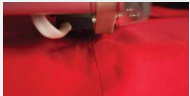
Trabalho realizado APÓS aplicação do calor. Material selado.