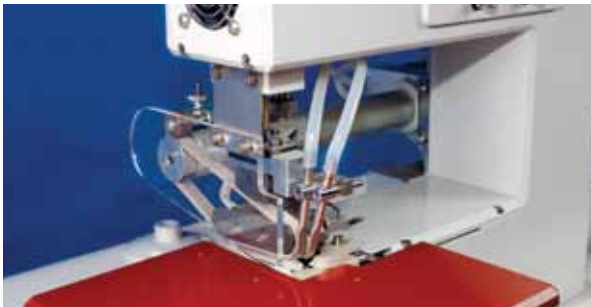
4 aquecedores de temperaturas programáveis: correias superior e inferior, 2 sopradores de ar.