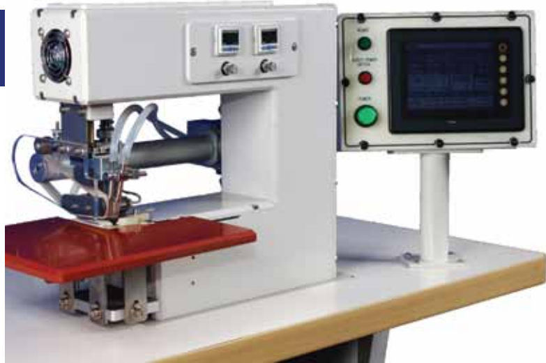
KHA-830 - Rebatimento de fita pré-aplicada

Sem Costura: Moda Fitness, Lingerie, Sportswear, Selagem de materiais diversos, EPIs (Equipamentos de Proteção Individual).