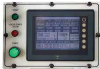
Controles e Programações em painel LCD, touchscreen.