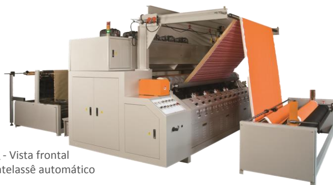
KQ - Vista frontal Matelassê automático

Produção de itens com valor agregado e altíssima produtividade em diversos materiais em rolo, multi-