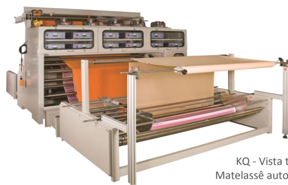
KQ - Vista traseira Matelassê automático