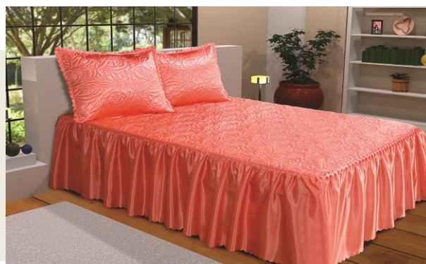
Colcha produzida com Matelassê por Ultrassom